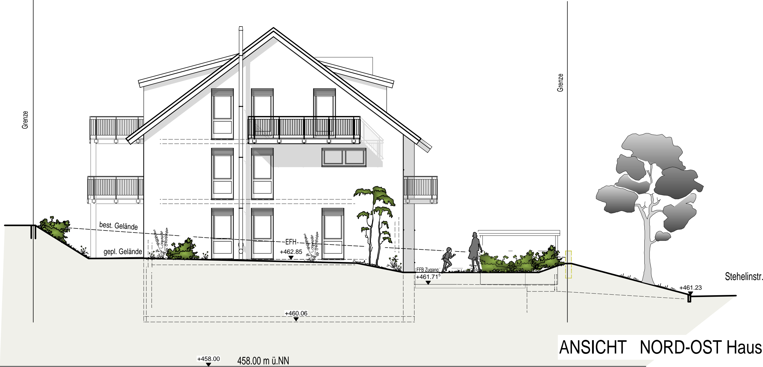
ANSICHT NORD-OST Haus 3