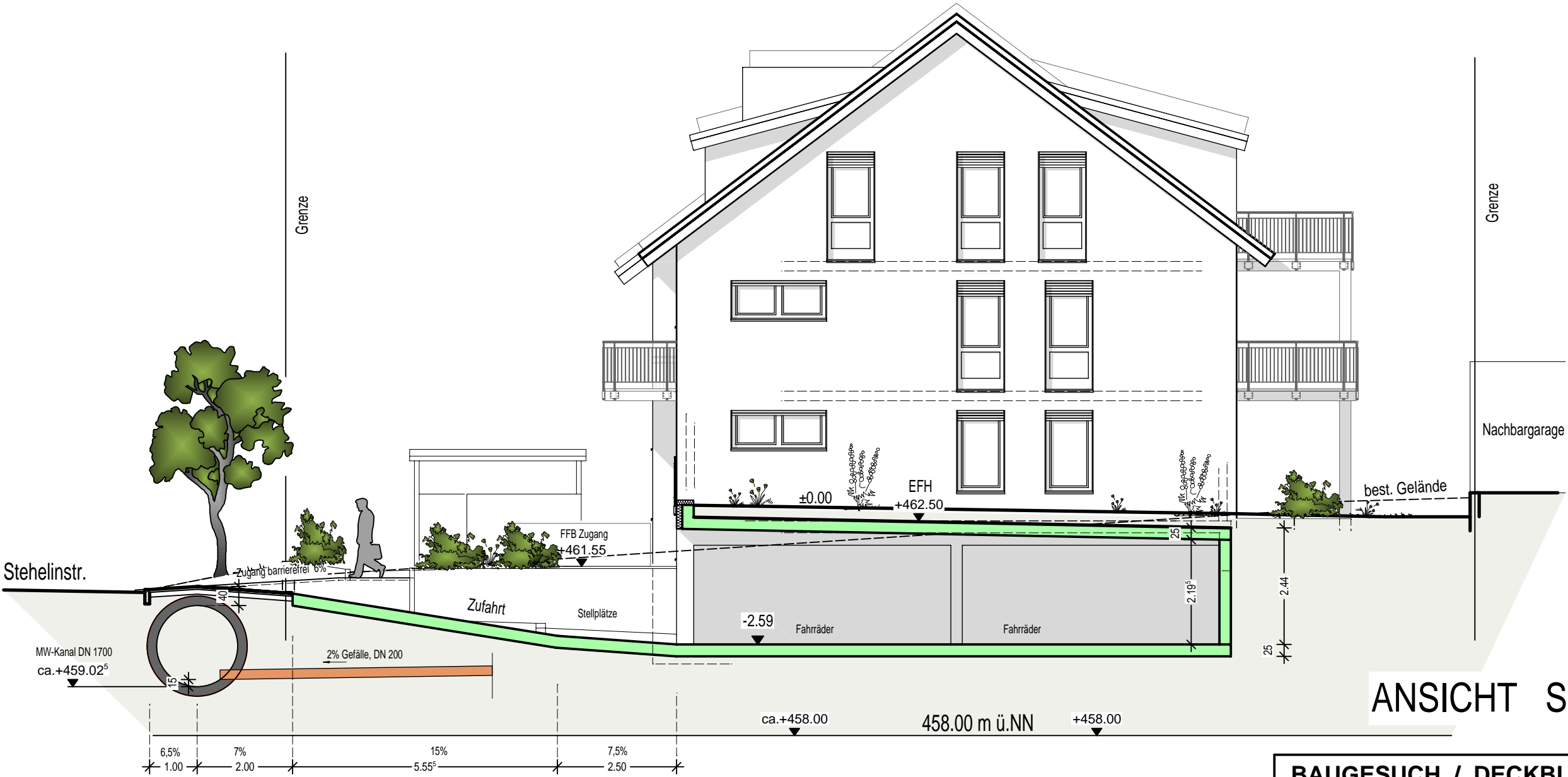
ANSICHT SÜD-WEST Haus 2